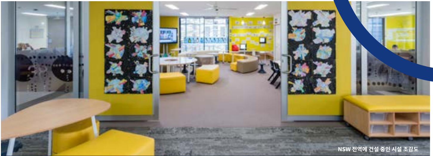
NSW 전역에 건설 중인 시설 조감도