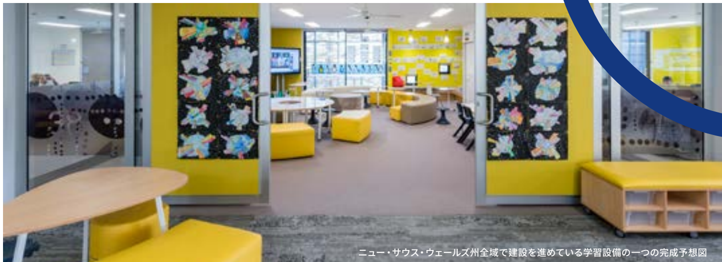
ニュー・サウス・ウェールズ州全域で建設を進めている学習設備の一つの完成予想図