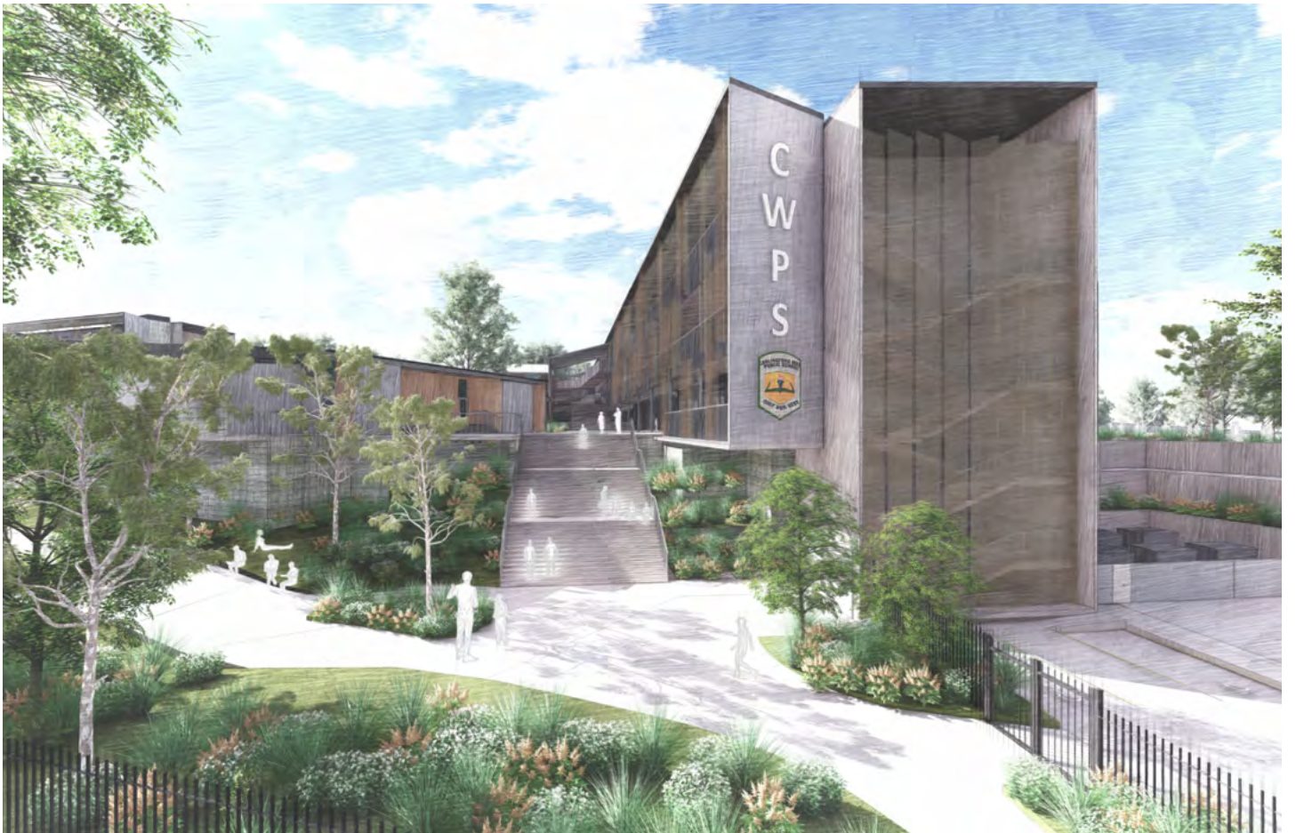
从Felton Road West路口向西面对新楼Y