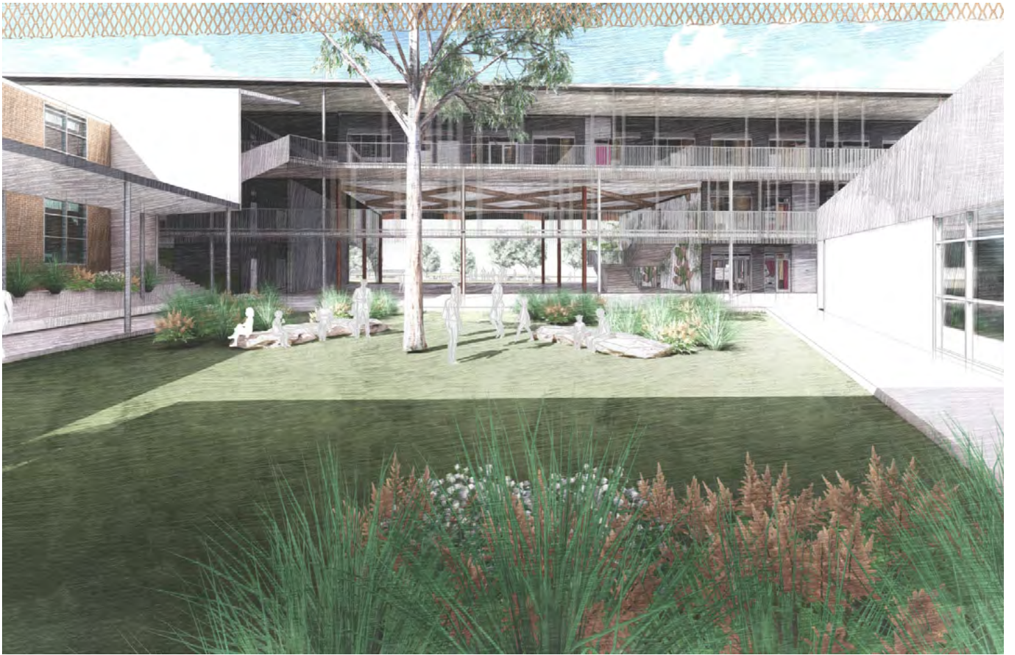
新楼J和C之间的庭院，从新楼Y俯视