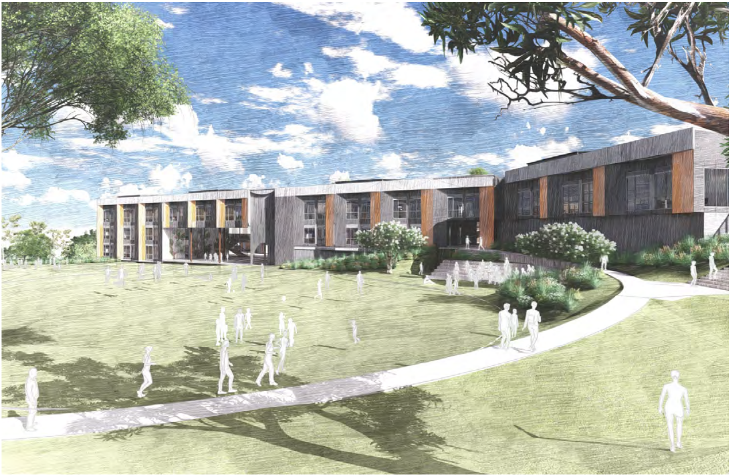
向西看，南运动场对面是新楼Y