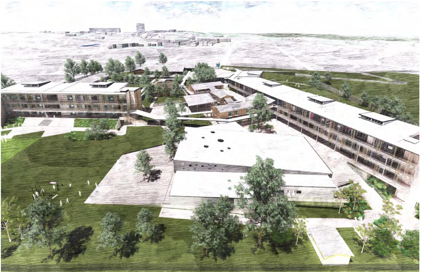
建成之后的Carlingford West公立学校，从Felton Road West边界处向东俯瞰规划图