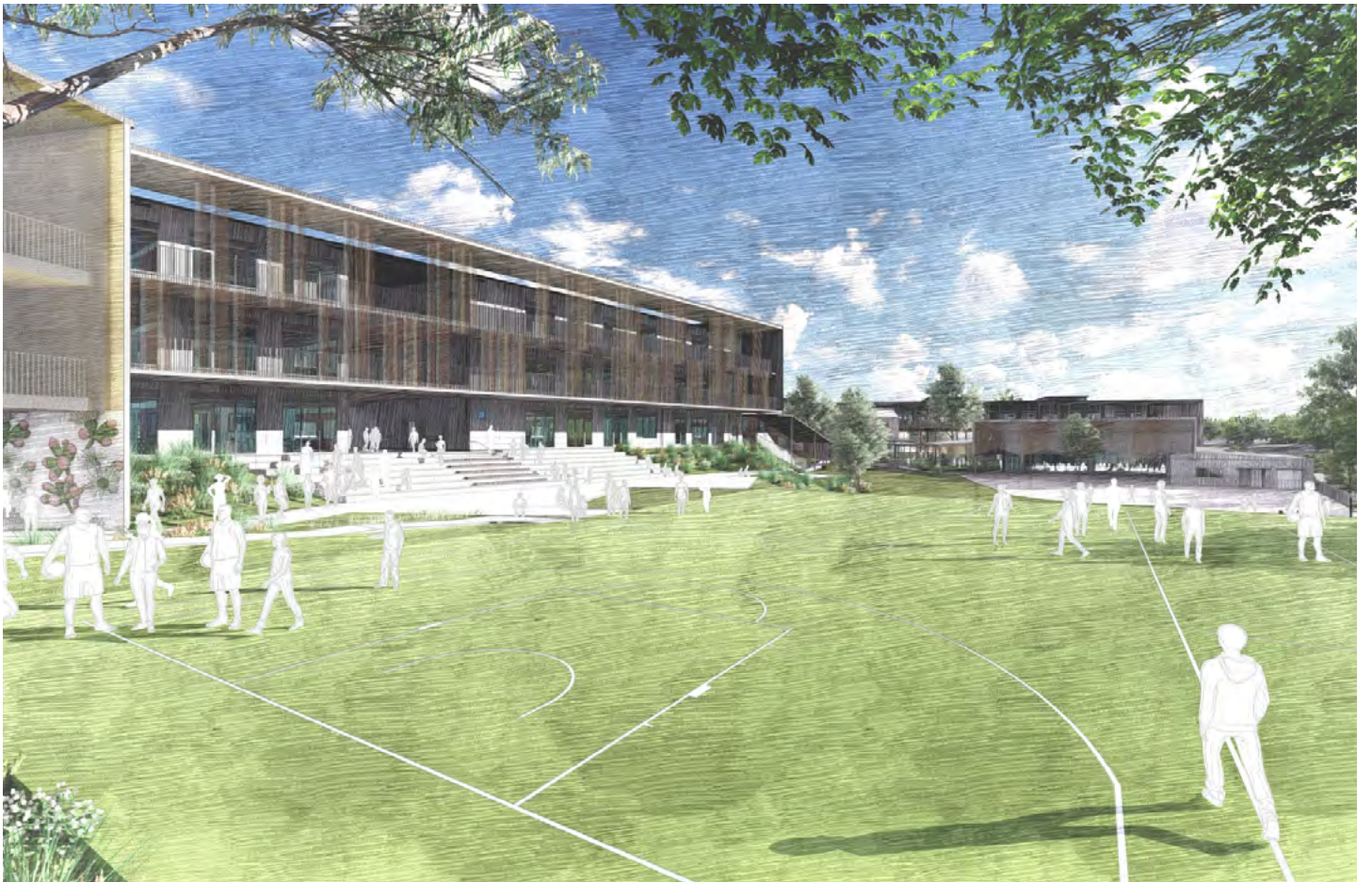
向南看，运动场对面是新楼J，左边是新楼X