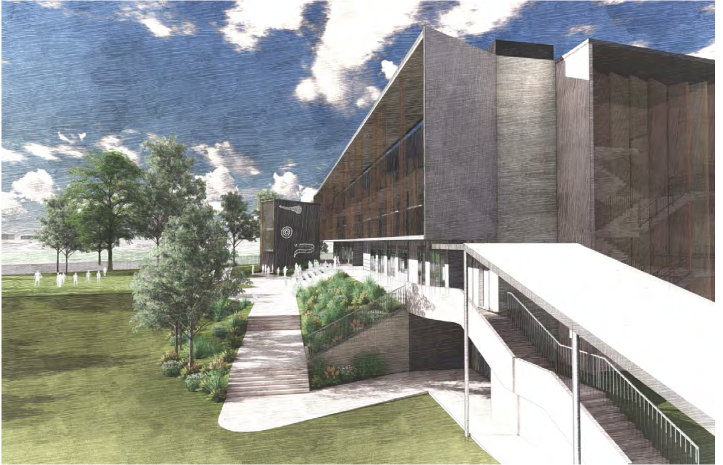
从楼C向北看，对面是楼X，北运动场在左侧